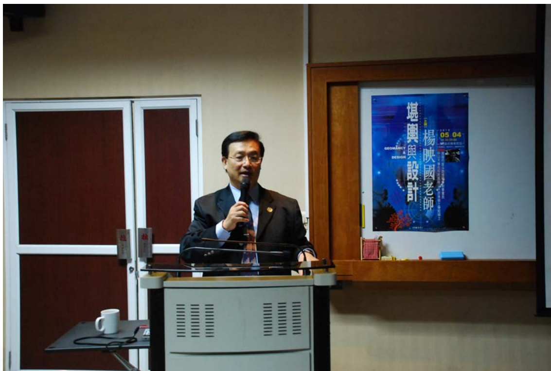
▶ 「風水」俗稱「地理」，學名「堪輿學」，名稱不同，意思卻相同。將「堪輿」融入「設計」，讓一項重視風水的東方人擴充知識。